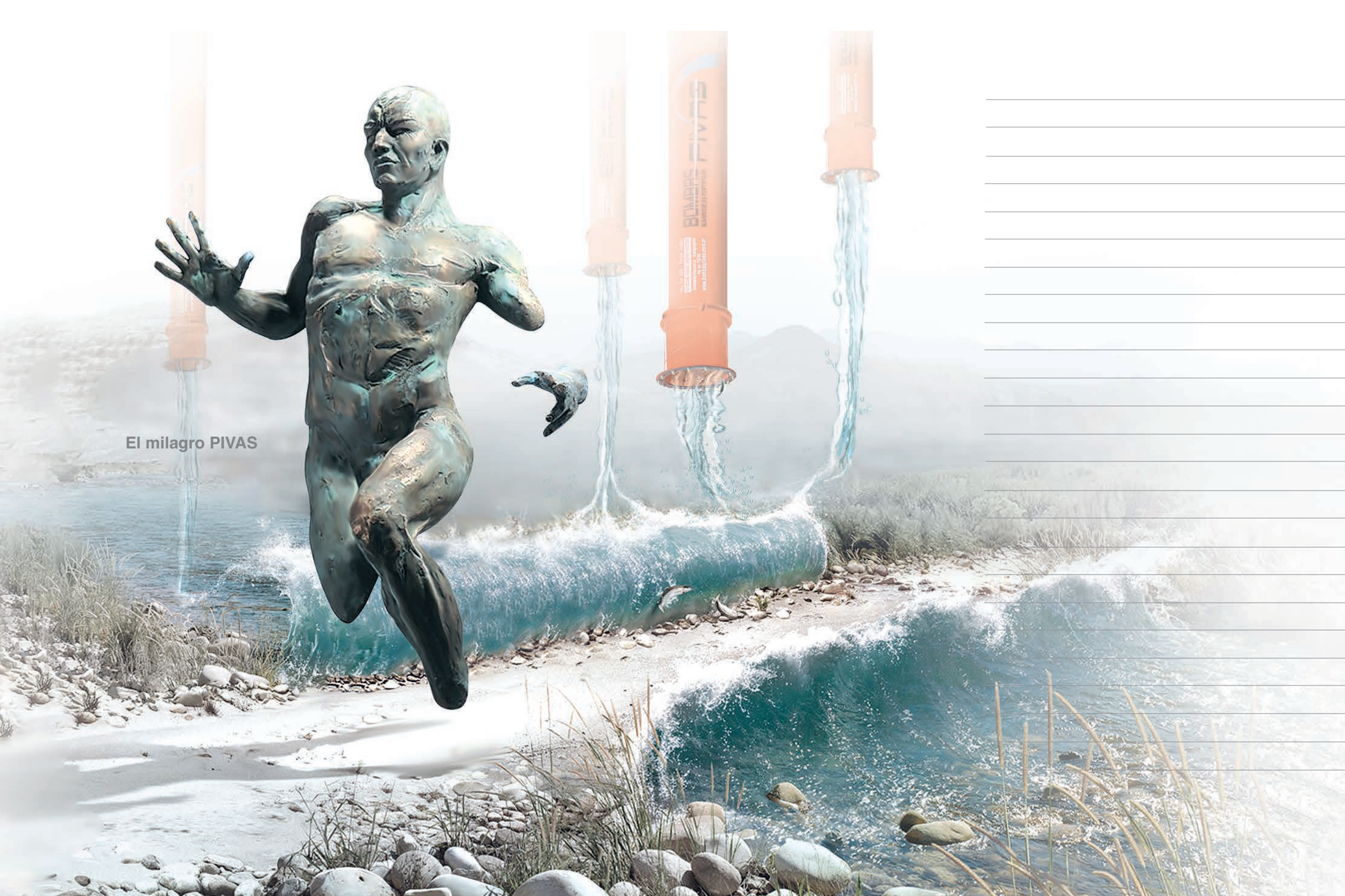
El milagro PIVAS

Un padre que trabajó con ENERGÍA cuando logró cumplir su sueño, no fue tan importante como aquello en lo que se convirtió por haberlo hecho.